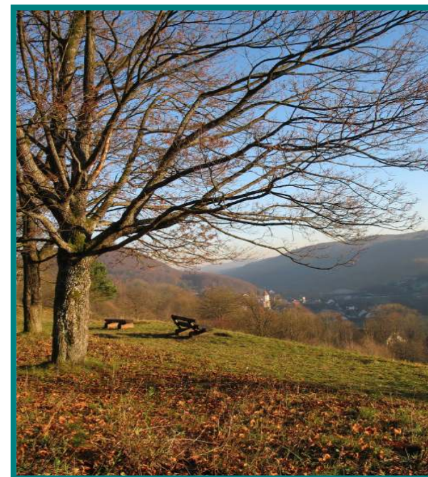
Auf der „Wied „ mit Blick auf Pommelsbrunn